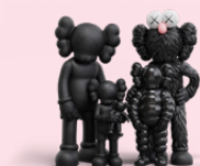
KAWS, FAMILY, 2021; © KAWS