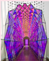
Olafur Eliasson, One-way colour tunnel , 2007

Olafur Eliasson: One-way colour tunnel En curso