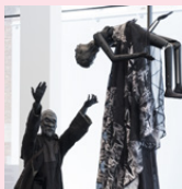
Kara Walker, Fortuna and the Immortality Garden (Machine), 2024