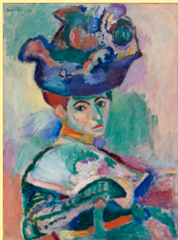
Henri Matisse, Femme au chapeau (Woman with a Hat), 1905